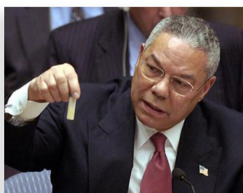
Discours de Colin Powell devant l'ONU, 5 février 2003, whitehouse.gov

Deux ans après les attentats du 11 septembre 2001, l'Irak est accusé par les États-Unis de détenir des armes de destruction massive. L'administration américaine construit son argumentation au mépris de la réalité : en 2003, Colin Powell, ministre des Affaires étrangères, présente des « preuves », dont un flacon d'anthrax, devant le Conseil de sécurité de l'ONU. En 2013, il reconnaît comme inexacts la plupart de ces « preuves ».