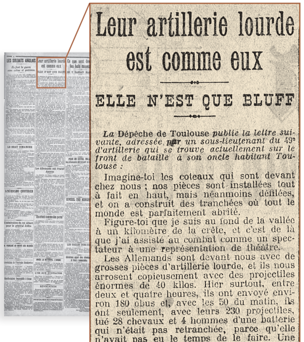
Le Matin, page 2, 15 septembre 1914

Entre 1914 et 1918, la presse est censurée et instrumentalisée par le ministère de la Guerre. Il faut, dit-on, éviter la divulgation d'informations stratégiques et soutenir le moral de la population. La propagande, à la limite du vraisemblable, ne se cache plus : « Les Allemands tirent bas et fort mal. Quant aux obus, ils n'éclatent pas dans la proportion de 80 % ».